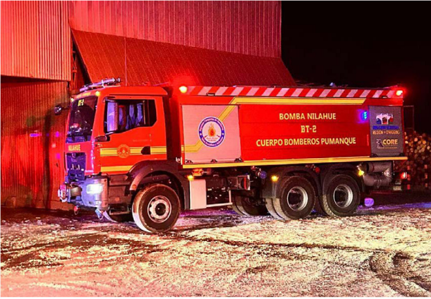
Bomberos de diferentes comunas llegaron al lugar de la emergencia.