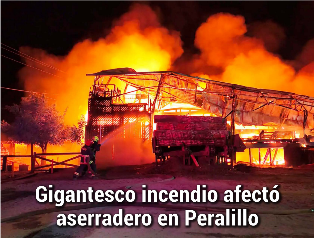
La emergencia afectó a un aserradero de la comuna de Peralillo.