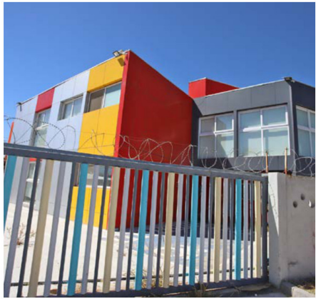
La Sala Cuna y Jardín Infantil Villa Araucaria, en el sector Chorrillos de Rancagua se mantiene con cierre perimetral y vigilancia permanente.

En una declaración institucional emitida el 06 de febrero, JUNJI Región de O'Higgins entregó una actualización en el marco de la respuesta al "Oficio de Fiscalización, solicitado por la Diputada Natalia Romero y remitido con fecha 12 de diciembre de 2025", precisando avances y plazos en recintos específicos. En el documento, el organismo señaló que "de acuerdo con la información contenida en el oficio de respuesta enviado a la parlamentaria, precisamos que los proyectos de construcción del Jardín Infantil 'Baquedano', en la comuna de Rancagua, y de conservación de la Sala Cuna y Jardín Infantil 'Rayito de Sol', en la comuna de