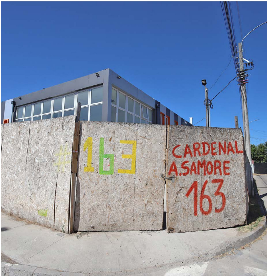
Obras con años de retraso, contratos terminados y avances desiguales marcan la situación de salas cuna y jardines infantiles JUNJI en la Región de O'Higgins.