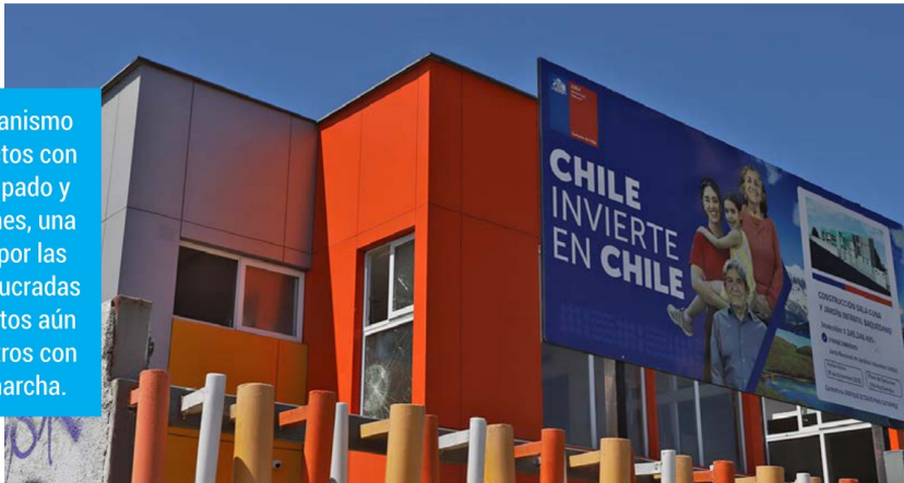
La Sala Cuna y Jardín Infantil Villa Baquedano, en Rancagua, también cuenta con resguardo permanente. Trabajos en marcha, en el marco de las reconstrucciones informadas por JUNJI.

Aunque el organismo reportó proyectos con término anticipado y reconstrucciones, una fiscalización por las comunas involucradas constató recintos aún sin faenas y otros con trabajos en marcha.