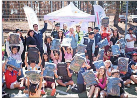
Tomé. La ministra (s) de Educación, el subsecretario del Interior y la directora de Junaeb entregaron mochilas y útiles a estudiantes damnificados de Punta de Parra.