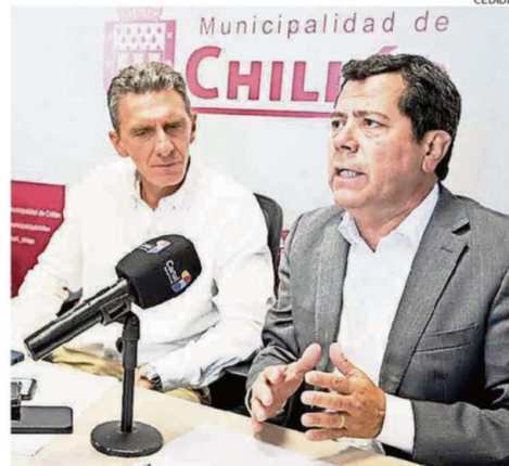
AUTORIDADES COMUNALES SE REFIRIERON A LOS OPERATIVOS.

"Ya sean operativos Puentes, ya sea sacando a la gente que está con construcciones precarias, que son los rucos, valoramos que es la misma ciudadanía la que nos llama y nos pide que intervengamos. Y también con las patrullas mixtas conformadas con Carabineros realizamos controles al comercio ambulante, donde también se han detectado sujetos cometiendo delitos y carabineros han procedido a detenerlos, además de los deteni-