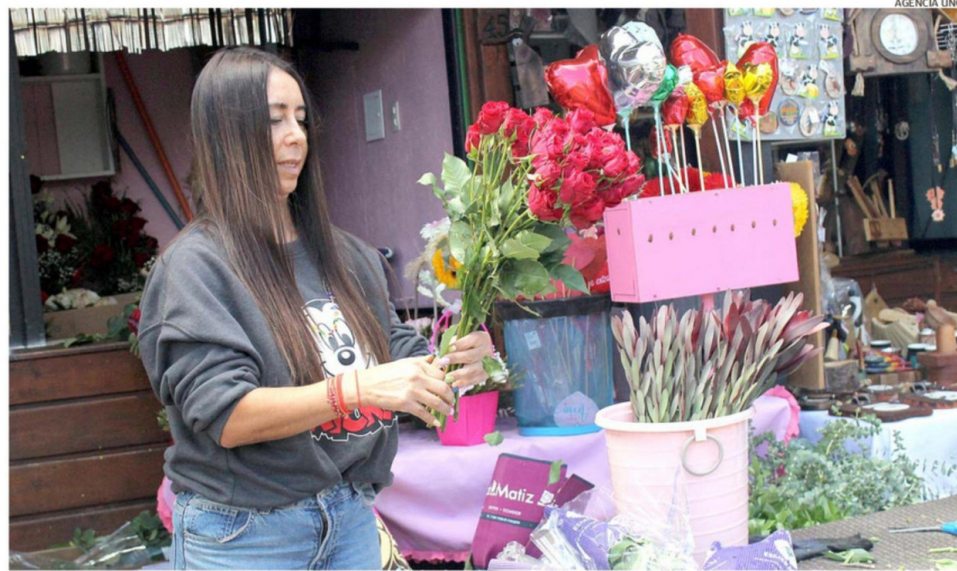
LOS ARREGLOS FLORALES SON UN CLÁSICO PARA SAN VALENTÍN EN LA FLORERÍA “JARDÍN DE OSORNO”, UBICADA EN EL PUEBLITO ARTESANAL.

MERCADO. La demanda local para sorprender a las parejas este sábado sigue con los clásicos ramos de rosas, chocolates y cenas románticas. Los más atrevidos suman opciones “pícaras”, como lencería, disfraces, vibradores, lubricantes, juguetes sexuales, promociones especiales en moteles, entre otros. Enamorados locales relatan cómo será su celebración.