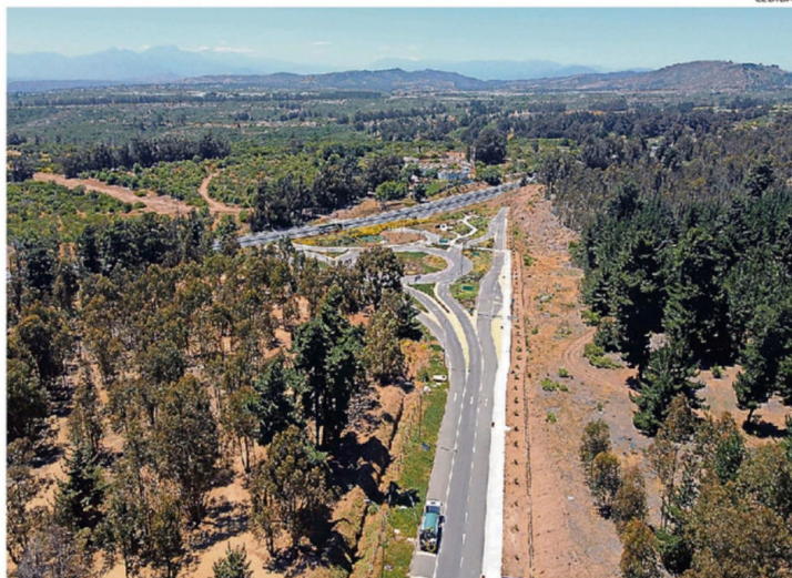
LA EJECUCIÓN TOTAL DEL PROYECTO SE PROYECTA COMO MÍNIMO, EN DOS AÑOS MÁS.

Según información entregada por el MOP, el