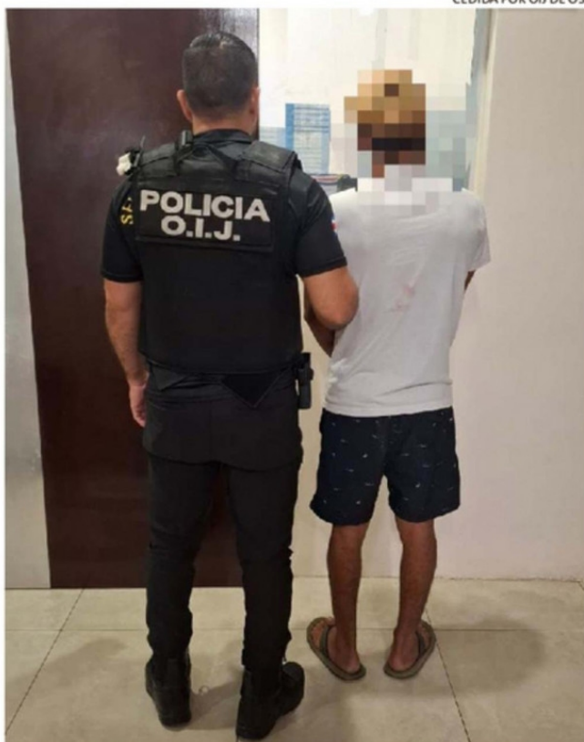
SE PEDIRÁ LA PRISIÓN PREVENTIVA POR EL IMPUTADO.