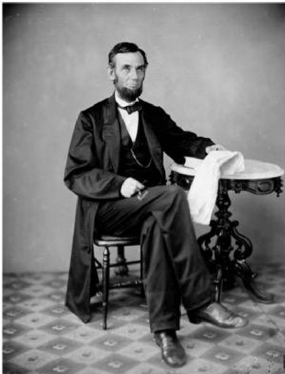
Abraham Lincoln consolidó la democracia en Estados Unidos aboliendo la esclavitud y defendiendo la unión nacional.