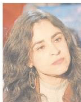
Diputada Javiera Morales.