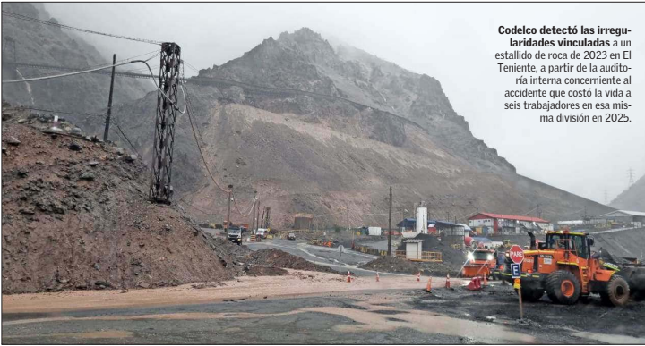
Codelco detectó las irregularidades vinculadas a un estallido de roca de 2023 en El Teniente, a partir de la auditoría interna concerniente al accidente que costó la vida a seis trabajadores en esa misma división en 2025.