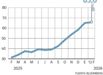
Acción BCI PRECIO EN PESOS