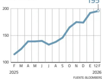
Acción Banco de Chile PRECIO EN PESOS