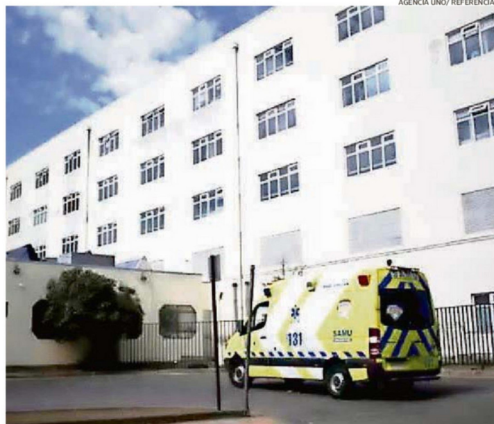
HECHOS OCURRIERON EL 10 DE FEBRERO DE ESTE AÑO.