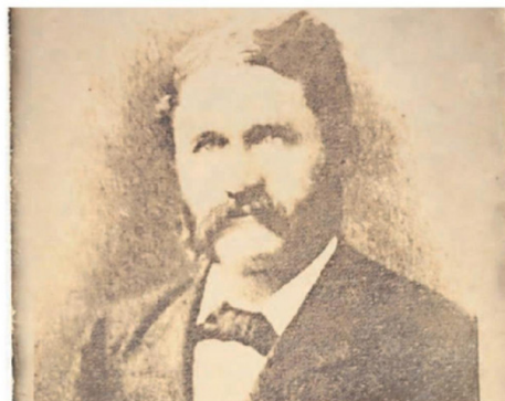
HICKS FALLECIÓ EN INGLATERRA EN ENERO DE 1909 A LOS 76 AÑOS.

estaba Antofagasta, donde operaba la compañía de ferrocarriles y salitres que administraba Hicks. Tras el terremoto de 1877, el gobierno de Bolivia, bajo la férula del presidente Hilarión Daza, decidió subir el impuesto a 10 centavos por quintal de salitre en 1878, pasando por alto lo establecido en el acuerdo de 1874.