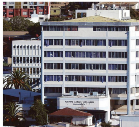
NUEVO HOSPITAL ES UNA DE LAS GRANDES DEUDAS DE LA ZONA.

ganismo aseguraron que han iniciado conversaciones con la Municipalidad de Valparaíso para evaluar el plano regulador del sector, actualmente limitado a tres pisos, con el fin de estudiar una eventual ampliación a ocho pisos, lo que permitiría maximizar la capacidad constructiva de la obra.