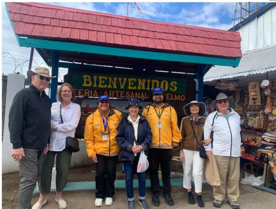
EN EL SECTOR DE ANGELMÓ, LOS MONITORES DE SEGURIDAD ENTREGARON INFORMACIÓN EN INGLÉS A LOS VIAJEROS DE AMBOS CRUCEROS.

seguridad de los turistas y orientarlos en inglés, desplegó ayer la Municipalidad de Puerto Montt.