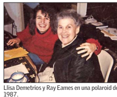
Lisa Demetrios y Ray Eames en una polaroid de 1987.

Una pareja que además es un ícono del diseño moderno: