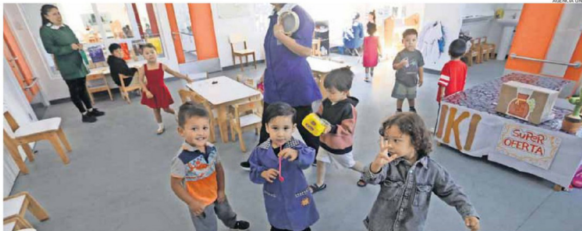
LA BAJA SE REPITE A NIVEL NACIONAL, SEGÚN INFORME DE LA SUBSECRETARÍA DEL RAMO.

Para Dinamarca, "se trata de una región marcada por alta migración, empleos organizados en sistemas de turnos, menor cobertura de jardines infantiles en algunos territorios y limitaciones tanto de recursos estatales como de recursos humanos especializados. Estas características dificultan el acceso efectivo, incluso cuando existe oferta formal". En cuanto al nivel nacional, la académica explica que persiste la idea de postergar la escolarización temprana, "especialmente cuando los costos son elevados. En ese escenario, el cuidado en el hogar aparece como alternativa, muchas