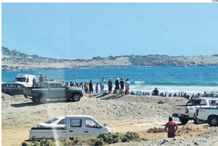
LAS VÍCTIMAS NO PUDIERON SER TODAS RESCATADAS CON VIDA.