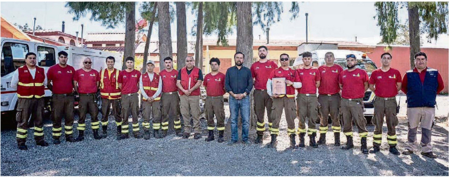
INSTANCIA DE RECONOCIMIENTO EN EL MARCO DEL DÍA NACIONAL DEL BRIGADISTA FORESTAL.