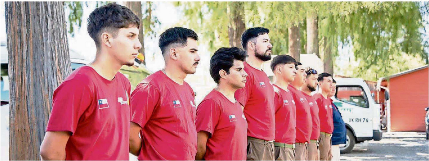
REPRESENTANTES DEL GOBIERNO REGIONAL DE ÑUBLE DESTACARON A LOS BRIGADISTAS FORESTALES DURANTE LA CEREMONIA.