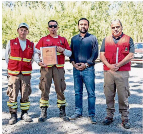
EL GOBERNADOR REGIONAL, ÓSCAR CRISÓSTOMO, VALORÓ EL TRABAJO DE LAS BRIGADAS, SUBRAYANDO SU VALENTÍA Y VOCACIÓN DE SERVICIO.