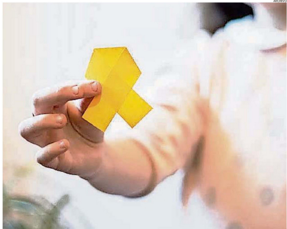
EXPERTA SE REFIERE A LOS PROTOCOLOS QUE INVOLUCRA EL TRATAMIENTO A NIVEL NACIONAL Y REGIONAL.