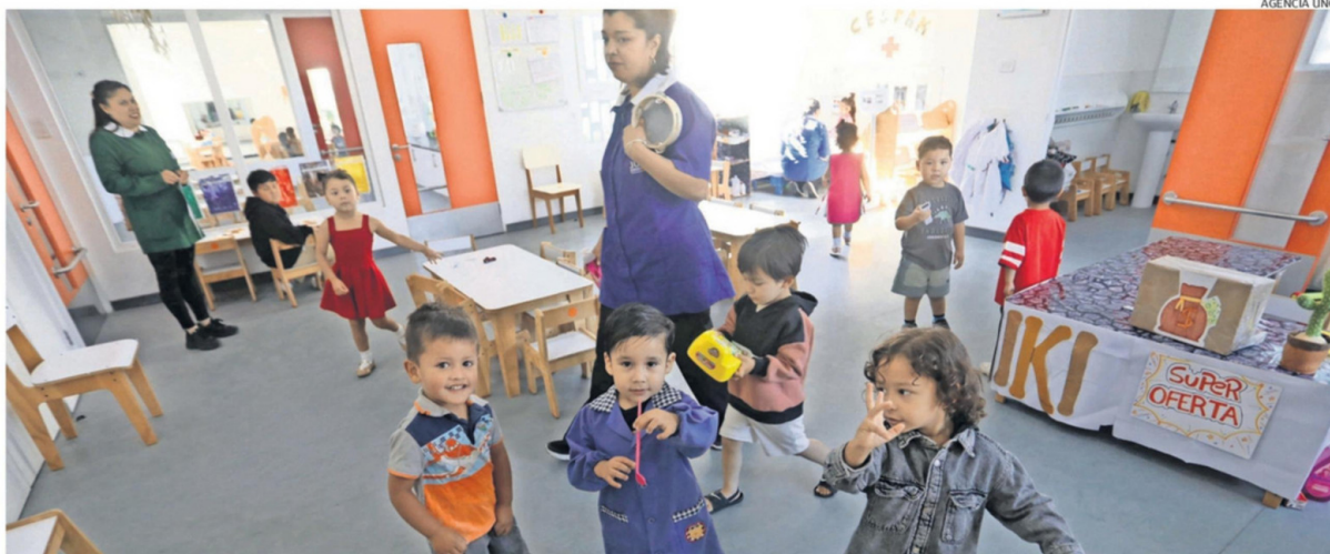
LA BAJA SE REPITE A NIVEL NACIONAL, SEGÚN INFORME DE LA SUBSECRETARÍA DEL RAMO.

Para Dinamarca, "se trata de una región marcada por alta migración, empleos organizados en sistemas de turnos, menor cobertura de jardines infantiles en algunos territorios y limitaciones tanto de recursos estatales como de recursos humanos especializados. Estas características dificultan el acceso efectivo, incluso cuando existe oferta formal". En cuanto al nivel nacional, la académica explica que persiste la idea de postergar la escolarización temprana, "especialmente cuando los costos son elevados. En ese escenario, el cuidado en el hogar aparece como