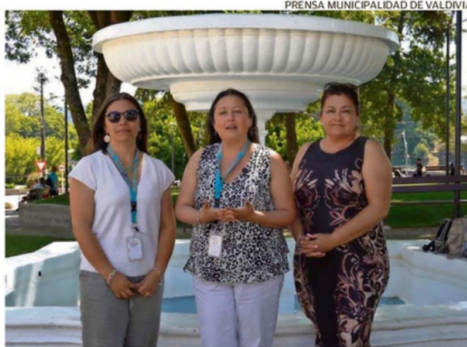
ONCOSUR ENTREGA ACOMPAÑAMIENTO A PERSONAS CON CÁNCER.

nización referente en inclusión social y accesibilidad, reconocida internacionalmente por su innovador modelo aplicado a eventos públicos.