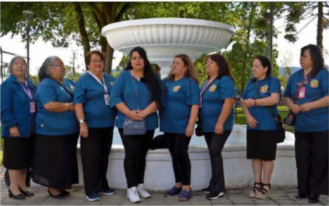
AGRUPACIÓN SOCIAL UN DÍA A LA VEZ.

lla: Una iniciativa comunitaria en pro de la defensa y protección del Humedal Angachilla.