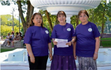
LA AGRUPACIÓN REDES QUE SANAN.