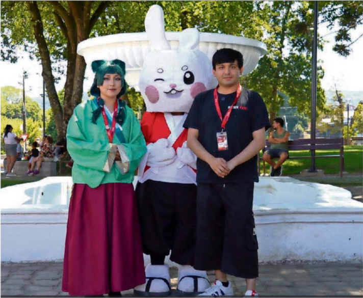
EL FESTIVAL AKIBA FEST ESTÁ NOMINADO COMO EVENTO EN LA CATEGORÍA DE CULTURA, ARTE Y PATRIMONIO.

son entregados de manera directa por los organizadores del Valdivia Destaca. Corresponde a las categorías "Dirigente destacado", "Huella valdiviana" y "Valdivia siempre".