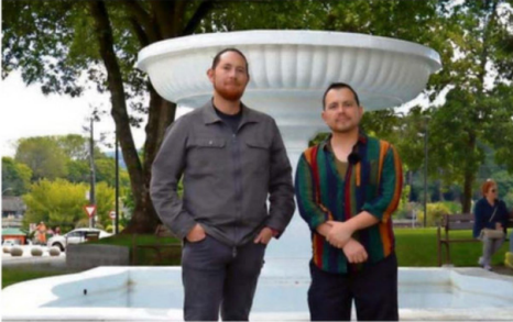
FUNDACIÓN SAN JORGE DESTACA POR SU TRABAJO EN LA COSTA.

Este proceso no solo se premia las trayectorias y proyectos, sino que también se fortalece el sentido de pertenencia, la participación y el orgullo por Valdivia. Cuando la ciudadanía se involucra de esta manera, queda claro que reconocer lo bueno que ocurre en nuestra ciudad también es una forma de construir futuro".