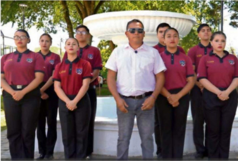
BANDA DE GUERRA DEL LICEO ARMANDO ROBLES RIVERA.

Fundación Creciendo Activos: Institución que promueve la formación integral de niños, niñas y adolescentes en contextos de vulnerabilidad, utilizando el deporte como herramienta.