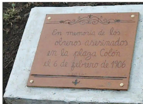
PLACA QUE RECUERDA A LOS CAÍDOS EN LA MASACRE DE ANTOFAGASTA.

“En el contexto de injustas condiciones laborales, los obreros del ferrocarril exigieron quince minutos más de colación y otras medidas menores, pero la Empresa las rechazó completamente; ante la negativa los trabajadores fueron apoyados por la Mancomunal obrera y otros colectivos ideológicos como los anarquistas que habían llegado a la localidad en 1905 integrándose a las faenas obreras y participando en