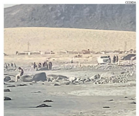
LA ZONA DONDE OCURRIÓ EL ACCIDENTE NO ESTÁ HABILITADA PARA EL BAÑO

ñaral y Flamenco son 35 km. Los tiempos fueron los correspondidos. Las ambulancias fueron escoltadas por Carabineros”.