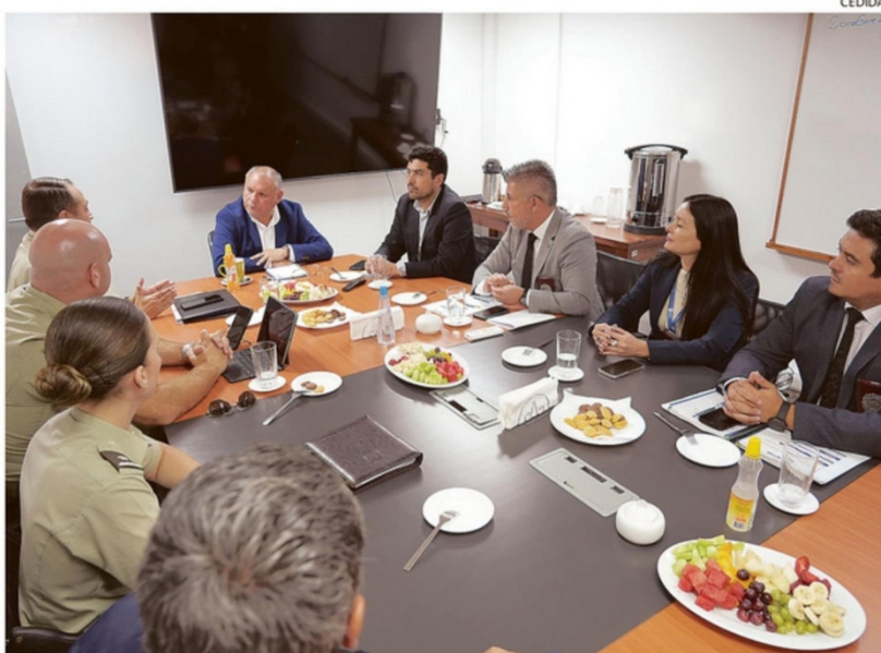
GOBIERNO REGIONAL, CARABINEROS Y PDI SE REUNIERON PARA AFINAR LOS PLANES DE EJECUCIÓN.

Respecto de los delitos que tienden a incrementarse, advirtió que “normalmente son los robos por sorpresa o lanzazos y los robos de especias al interior de vehículos”, haciendo un llamado al autocuidado.