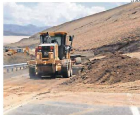
TRABAJOS DE HABILITACIÓN DE RUTAS REGIONALES E INTERNACIONALES

Eso considerando, que “como estamos con alerta temprana, la situación climatológica está siendo bien dinámica, particularmente en el sector cordillerano, donde ya durante todas las últimas jornadas, horarios vespertinos y nocturnos se han registrado precipitaciones