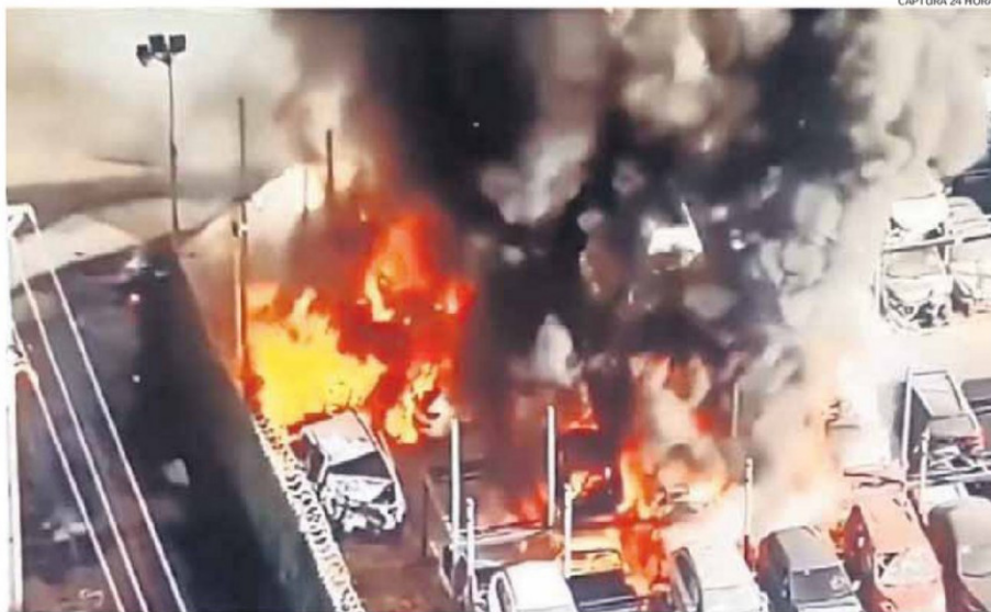
EL VOLCAMIENTO DEL CAMIÓN PROVOCÓ UNA EXPLOSIÓN QUE SE EXPANDIÓ POR CERCA DE 200 METROS.

Además, indicó que del resto de las víctimas cuatro fueron derivadas al Hospital del Trabajador y otros cuatro a clínicas privadas. "Las quemaduras generan no solamente problemas en la piel y pérdida de volumen sanguíneo, sino que también generan problemas respiratorios (...) Lo importante en esta etapa es la estabilización hemodinámica, es decir, que las personas tengan sufi-