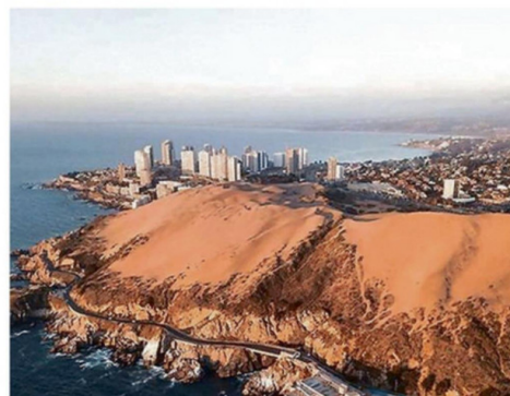
ARAYA: "CADA GRANO QUE SE PIERDE, SE PIERDE PARA SIEMPRE".