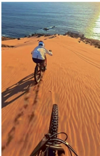
"THIS WAS INSANE!" (¡FUE UNA LOCURA!). ASÍ DESCRIBIÓ FISCHBACH LA ACTIVIDAD EN SU VIDEO.

No obstante, tanto expertos en geografía e ingeniería forestal, como