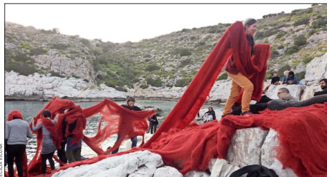
Cecilia Vicuña, con uno de sus Quilpas que sumergió en el mar.

Los aportes de las pintoras, escultoras, instaladoras y performancistas de la escena nacional han sido notables. Muchas, desafiando sus tiempos, con enorme valentía son pioneras en lo suyo. Escogimos a 10 de ellas, que van desde las talentosas hermanas Mira, de fines del siglo XIX, hasta Cecilia Vicuña.