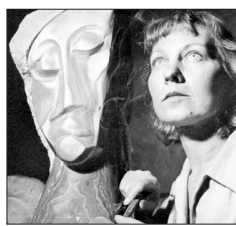
Lily Garafulic: Abrió el camino a la abstracción en la escultura.