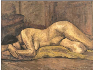
Henriette Petit: Québró esquemas con su lenguaje y desnudos que anticipan lo contemporáneo.