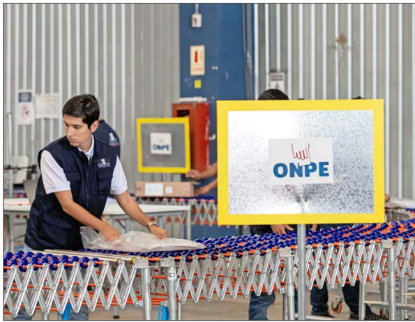
UN HOMBRE ORGANIZA el material electoral de cara a la primera vuelta en Perú.

“En muchos estudios hechos por Vox Populi hemos llegado a la conclusión de que el número real aproximado de indecisos es del 50% en el último mes antes de la elección, 25% a 30% en la última semana y 12% a 14% en el mismo día. En ese sentido, para elec-