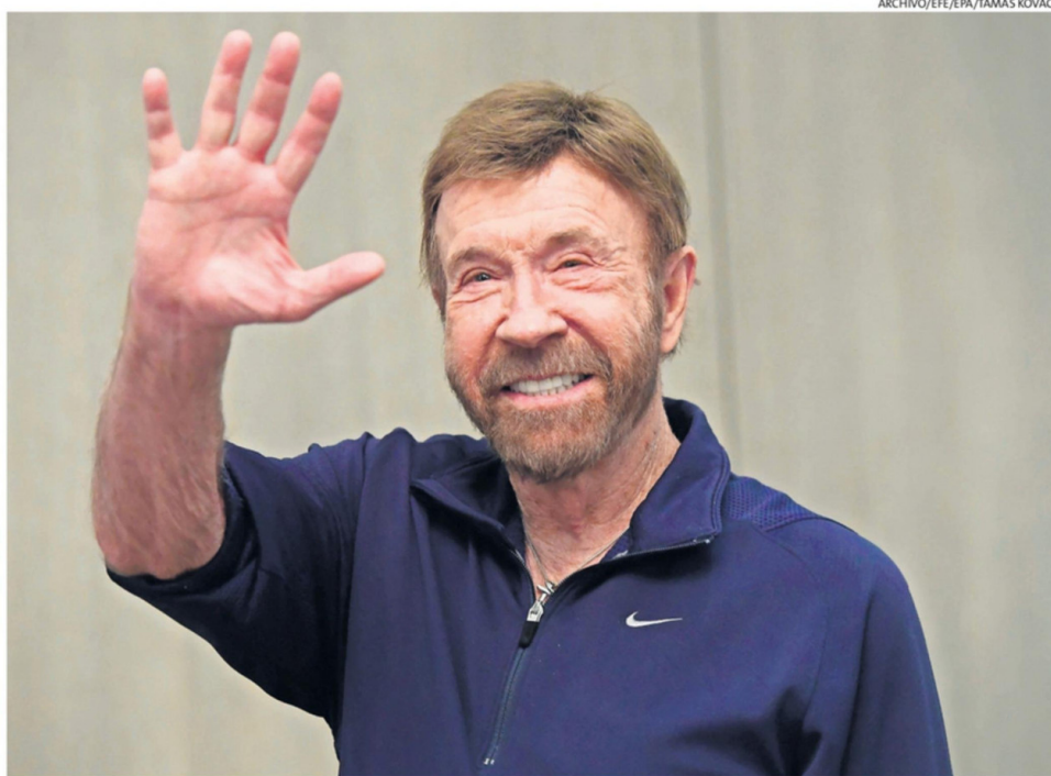
EL ACTOR FUE INTERNADO REPENTINAMENTE EN UN CENTRO MÉDICO EN HÁWAI. EL 10 DE MARZO HABÍA CELEBRADO SU CUMPLEAÑOS.

"Probé gimnasia y fútbol americano en la preparatoria North Torrance", le contó a The Asso-