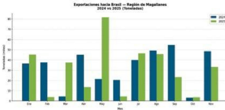
Comparativa de las exportaciones enviadas a Brasil.

La categoría Resto de Industria — que agrupa actividades industriales no clasificadas en las anteriores— fue el factor determinante en los meses de mayor crecimiento. En mayo de 2025 saltó 745,8% interanual, con US$102,5 millones,