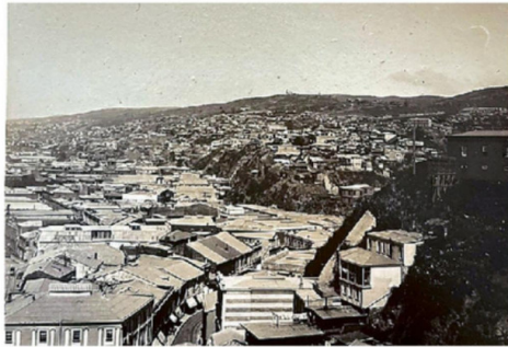
PLAN Y PARTE DE LOS CERROS DEL VALPARAÍSO DE ANTAÑO.