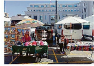
BENEFICIADOS SON DE LA COMUNA.