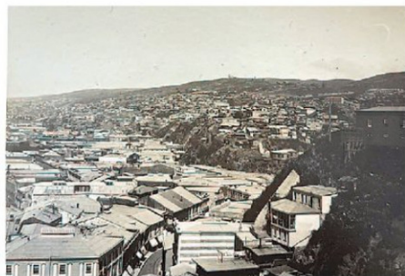
PLAN Y PARTE DE LOS CERROS DEL VALPARAÍSO DE AÑATOÑO.