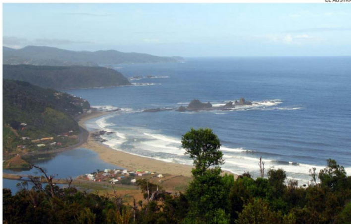
SAN JUAN DE LA COSTA ESTÁ AFECTADO POR EL CLIMA Y EL MAL CAMINO.

“Aunque el movimiento turístico en esta época no es alto, estas actividades permiten generar dinamismo en los meses más lentos. Hoy estamos atentos a lo que ocurra y a las posi-