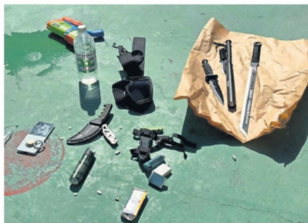
LOS ELEMENTOS QUE PORTABA EL ALUMNO AGRESOR.

También, en fotografías que fueron difundidas posteriormente, se puede leer que, en una de las ho-