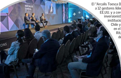
El "Arcalis Toesca Day" reunió a 12 gestores líderes de EE.UU. y a cerca de 250 inversionistas institucionales de Chile y la región en el hotel The Ritz-Carlton de Santiago