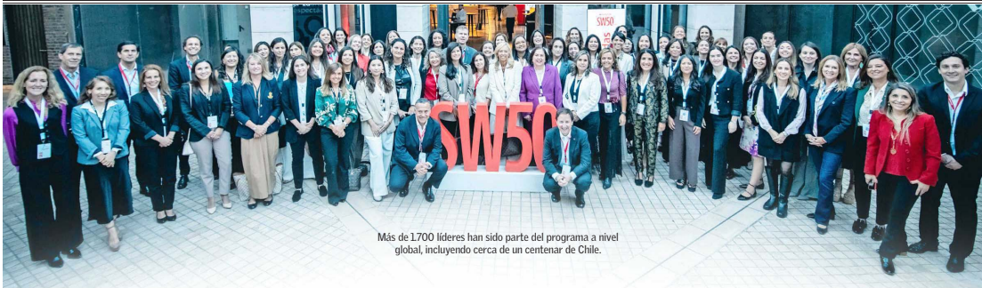
Más de 1.700 líderes han sido parte del programa a nivel global, incluyendo cerca de un centenar de Chile.