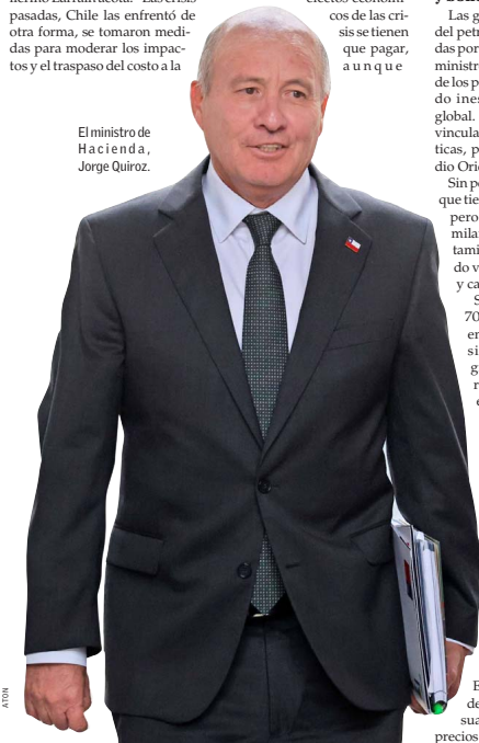
El ministro de Hacienda, Jorge Quiroz.

Contáctate a tu ejecutivo EL MERCURIO ATENCIÓN COMERCIAL 2 2330 1221 - 2 2330 1794 Publica tus avisos toda la semana