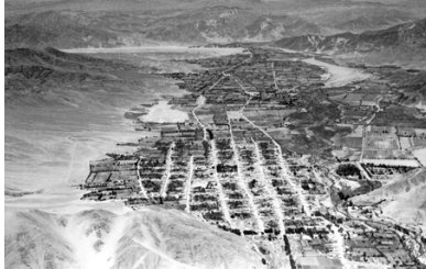
PASADO. Así se veía Copiapó desde el aire en los años 30. Al lado, los barrancos y caminos mineros del sector donde aterrizaron Mermoz y Collenot. Esta historia quedó contada en la biografía Mermoz , escrita por Joseph Kessel, amigo del piloto.

“Hallamos vestigios de ocupación inca y preinca en los alrededores del plateau descrito por Mermoz”, dice Marc Turrel, so-