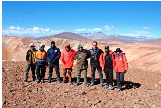
EQUIPO. En la expedición también participaron miembros de Socorro Andino, la Asociación de Turismo de Atacama y Conaf. Aquí, en el portezuelo donde Mermoz fue atrapado por una corriente descendente.