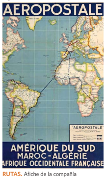
RUTAS. Afiche de la compañía