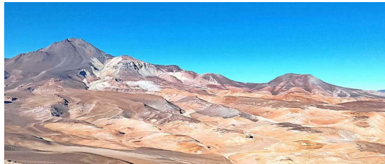
CORDILLERA. Arriba, la búsqueda del “Plateau de los Tres Cóndores” se realizó en dos vehículos todoterreno. Abajo, vista hacia el volcán Copiapó y la cuenca geográfica donde Mermoz aterrizó de emergencia.