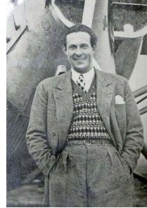
AVIADOR. Jean Mermoz desapareció en el Atlántico en 1936. Tenía 34 años.