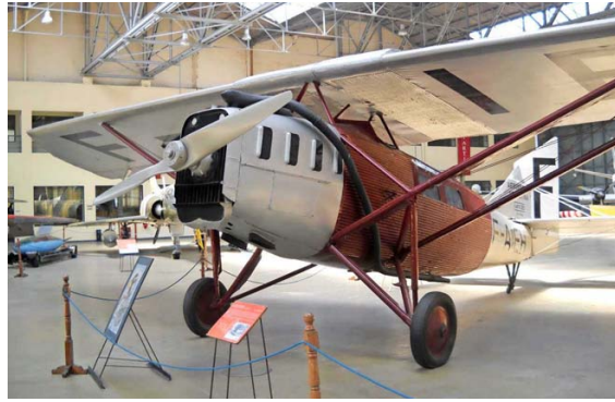
AERONAVE. Un modelo del Latécoère 25 en el que voló Jean Mermoz se conserva en el Museo Nacional de Aeronáutica de Morón, provincia de Buenos Aires.

Collenot fue a buscar sus herramientas y ambos se pusieron a trabajar, a más de 4.000 metros de altura y con 15 grados bajo cero de temperatura. Retorcieron alambres, extrajeron piezas secundarias e intentaron hacer funcionar nuevamente el motor. Posteriormente, sacaron los asientos, los tanques de combustible, la rueda