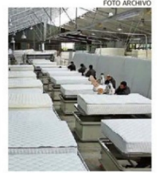
EL CRECIMIENTO SOSTENIDO HA IDO ACOMPAÑADO DE UN FUERTE DESARROLLO DE CAPITAL HUMANO.