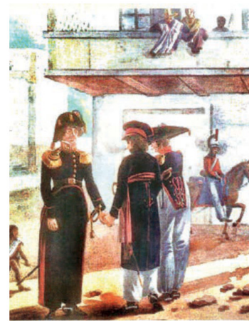
Gentes de Chile. Acuarela de Giast.

Las causas fácticas de esa insurrección -denominada Motín de Talca de 1827-, no solamente fueron el atraso en los pagos de la tropa, sino que incidió también el desorden político existente en el país, lo que el periódico "El Verdadero Liberal" del 31 de julio de ese año acentuó. En síntesis, fue un conflicto básicamente "gremial", originado en el no pago de sueldos en forma oportuna. Pese a tratarse de un evento específico, por tanto, no necesariamente representativo de todas las sublevaciones militares del periodo 1823-1829, da cuenta de un tiempo de gran inestabilidad política, aunque de corta duración y no extremadamente cruenta. ●