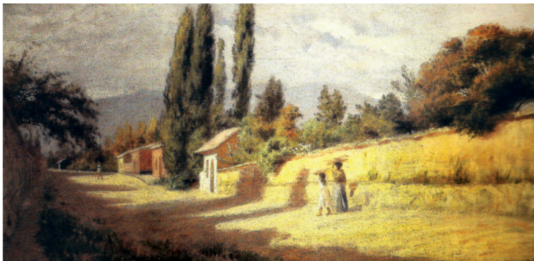
La somnolienta Villa San Agustín de Talca sufrió en 1827 uno de los grandes motines del período republicano de la primera mitad del siglo XIX. Evocador óleo sobre tela de Pedro Lira: “Atardecer. Escena de pueblo”. Colección privada del señor Canata.

Al respecto, el 7 de marzo de 1812 la Junta de Gobierno de Santiago, controlada por el coronel José Miguel Carrera, envió a Talca al Regimiento Granaderos, integrado por 900 soldados y 200 milicianos de caballería, al mando del brigadier Juan José Carrera, con el fin de impedir el avance de tropas penquista a la capital comandadas por el brigadier Juan Martínez de Rozas. Asimismo, el 18 de abril del mismo año el general Carrera salió de Santiago -investido de amplios poderes y con su amigo Manuel Rodríguez - rumbo a Talca, con una escolta de tropas de caballería, despachando el 25 de ese mes a un ayudante rumbo a Concepción con documentos para Rozas, en los que anunciaba que todo se zanjaría si ambos celebraban una conferencia en Talca, para lo cual la Junta de Gobierno penquista se trasladó desde Concepción hasta Linares escoltada por Rozas, quien avanzaba rumbo a la ribera del Maule con mil soldados de línea (Dragones de la Frontera) y 7 mil milicianos. Dicho ejército instaló su cuartel general en Linares, y Rozas, premunido de plenos poderes para negociar, pasó el río Maule con un reducido séquito a la orilla opuesta donde le esperaba Carre-