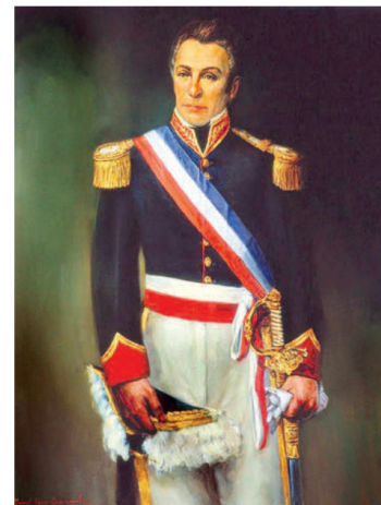
En las elecciones del 13 de febrero de 1827, para el período 1827-1832, fue electo Presidente el general Ramón Freire, quien poco después renunció en el Vicepresidente Francisco Antonio Pinto -en la gráfica-, quien gobernó hasta el 2 de noviembre de 1829.