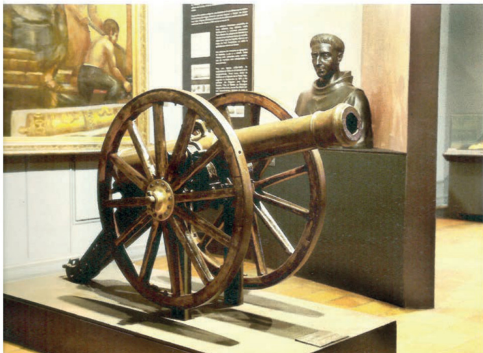
Cañón de época que se exhibe en el Museo de la Escuela Militar del General Bernardo O'Higgins.

...sos" nueve años se promulgaron dos constituciones: la moralista de 1823 y la liberal de 1828, además del llamado Ensayo Federal de 1826.