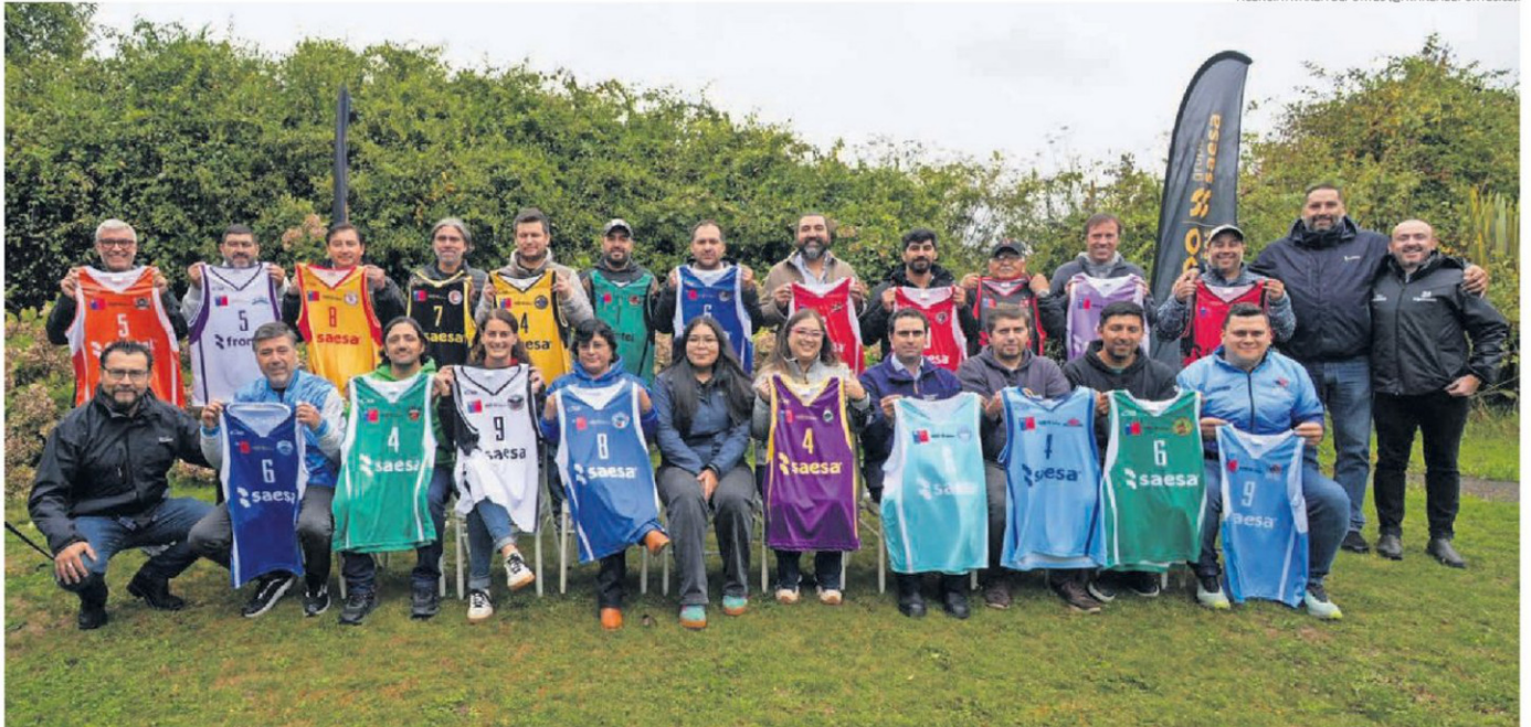
EN LA CIUDAD DE OSORNO SE REALIZÓ HACE UNOS DÍAS LA TRADICIONAL REUNIÓN DE PRESIDENTES EN QUE LA COORDINACIÓN DE LIGA SAESA ENTREGÓ LA INDUMENTARIA OFICIAL PARA LA TEMPORADA 2026.

AGENCIA AVANZA DEPORTES (@AVANZADEPORTES.CL)