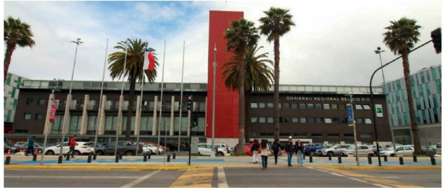
EL GOBIERNO REGIONAL DEL BIOBÍO aprobó más de 500 millones de pesos para las comunas de Cabrero, Yumbel y Nacimiento para diversos proyectos sociales.

“Tuvimos la oportunidad de estar en el Consejo Regional y viendo cómo eran las instancias de votaciones, que de repente uno como ciudadanía no entiende y tampoco lo ve, así que eso es gratificante, nos vamos muy agradecidos, nuestra junta de vecinos está conformada por gran parte de adultos mayores, así que sé que nuestros adultos mayores van a estar muy contentos y con la esperanza de que van a poder ver y anhelar ocupar esa linda sede y esa linda construcción que se va a hacer, así que estamos muy agradecidas y contentas” manifestó. Porsu parte, el alcalde de Naci-