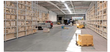
Las instalaciones cuentan con un área de acceso amplia y expedita.

logísticos enfocados principalmente en Build to Suit .”