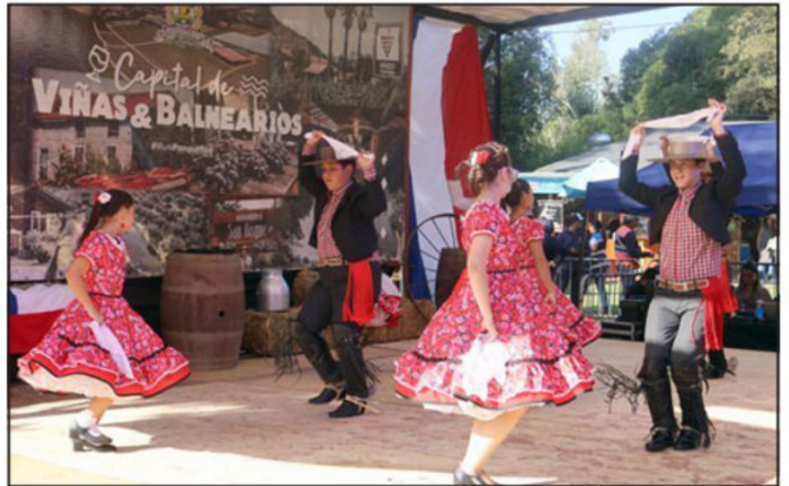
La cueca no podía faltar en esta tradicional actividad.