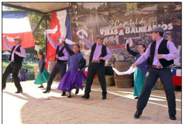
Los bailes típicos alegraron la jornada.