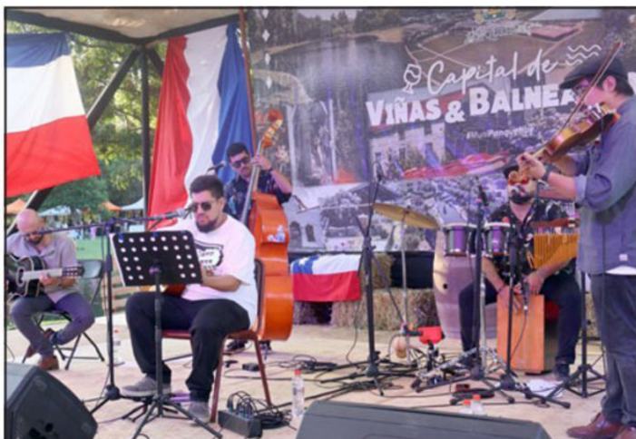
La música decoró esta exitosa fiesta.