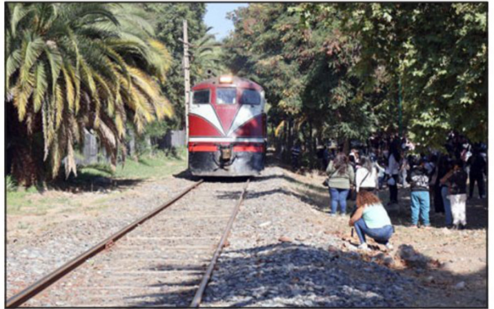
Tren del Recuerdo llegó de Santiago hasta la Vendimia de Panquehue.

Además, agregó que « esta fiesta cada vez se consolida más como algo muy propio de la Municipalidad de Panquehue, así que estamos felices de poder hacerlo acá, en un lugar tranquilo. Vienen cerca de 2.000 personas, así que esperamos seguir haciendo esta fiesta que une a la gente del campo con la ciudad », cerró.