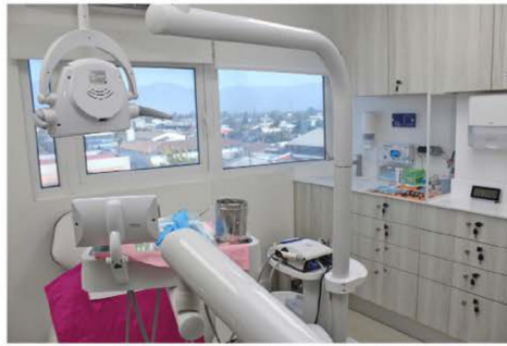
Las modernas dependencias de Ecolook Dental, espacio orientado a la prevención y tratamiento de la salud oral en mujeres embarazadas.