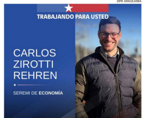
EL SEREMI DE ECONOMÍA SE ACOGIÓ A LA REPROGRAMACIÓN LEGAL.