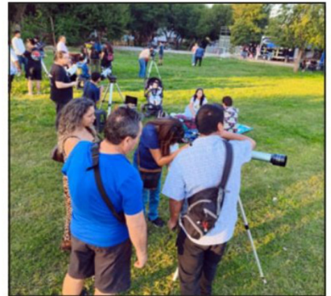
Gran convocatoria tuvo la actividad en Calle Larga.