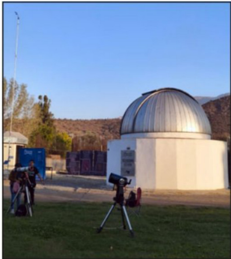
Una jornada de ciencia y comunidad frente al telescopio Bochum.

ciencia, la educación y la participación comunitaria, posicionando a la comuna como un referente en el desarrollo de actividades astronómicas a nivel local.