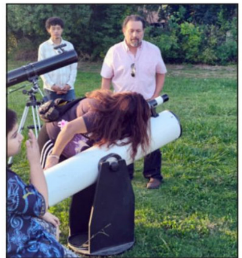
El objetivo tuvo que ver con aprender a mejorar el uso de los telescopios.

hemos desarrollado aquí», estableció la edil.